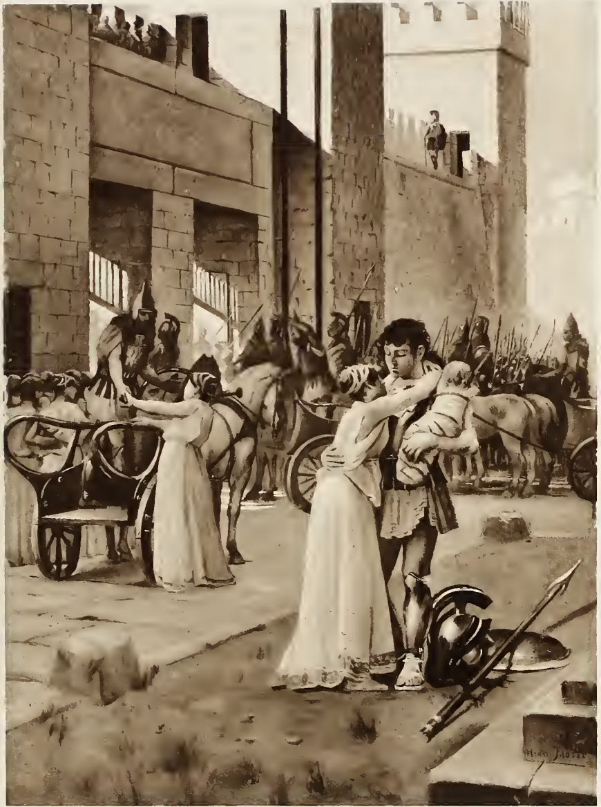
H. MOTTE INV.